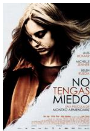
Premi fada a la Cultura 2013 "No Tengas Miedo" (2011) Direcció i guió: Montxo Armendariz