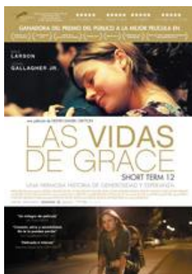
Pel·lícula "Las Vidas de Grace" (2013) Direcció: Destin Daniel Cretton